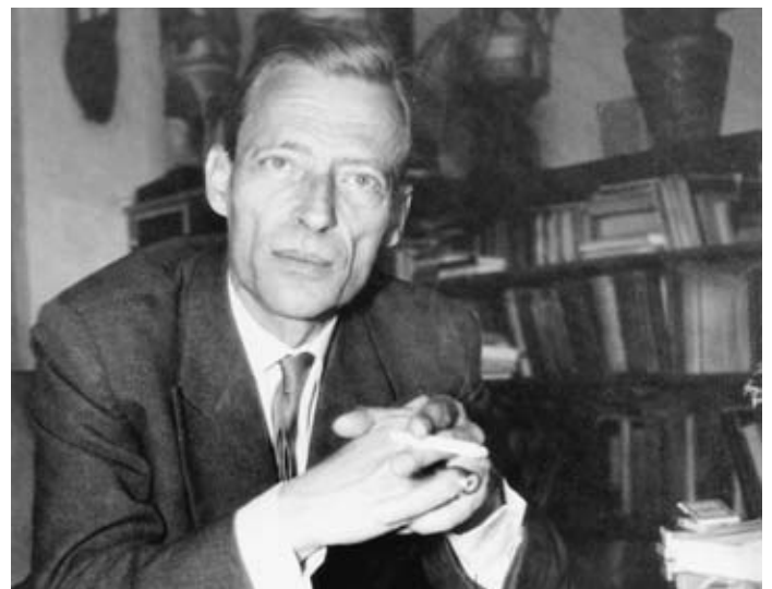
Jean Gebser in Hamburg, 1964/65.

Gebser's Werk ist auf die Zukunft bezogen, es macht in der Gegenwart auf die «Spuren» einer gemeinsamen, sinnvollen Zukunft aufmerksam. Gebser's Hauptwerk «Ursprung und Gegenwart» weist auf den Reichtum des menschlichen Bewusstseins hin. Gebser zeigt darin, dass unser Bewusstsein auf eine geheimnisvolle Weise mehrfach strukturiert ist. Bewusstsein ist nicht, wie wir oft meinen, mit verstandesmässigem Begreifen identisch. Für unser rationales Denken unfassbare Fähigkeiten und Bereiche: den magischen Weltbezug und die mythischen Weltdeutungen sind nach Gebser so gültig und wertvoll und vor allem so wirksam wie die begriff-